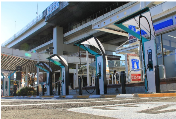
「2020 年度グッドデザイン賞受賞」 新型 EV 用急速充電器

両者は、今後も引き続きパーキングエリアにおける EV 用急速充電器の整備を進め、EV・PHV で首都高をご利用いただくお客さまの利便性向上に貢献いたします。