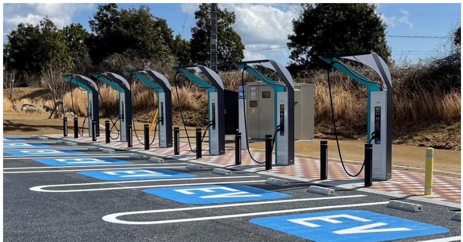
写真-1 マルチコネクタタイプ(6口)EV 急速充電器 (浜松SA(下り線))