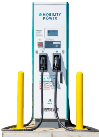
図-2 2台同時充電可能な急速充電器